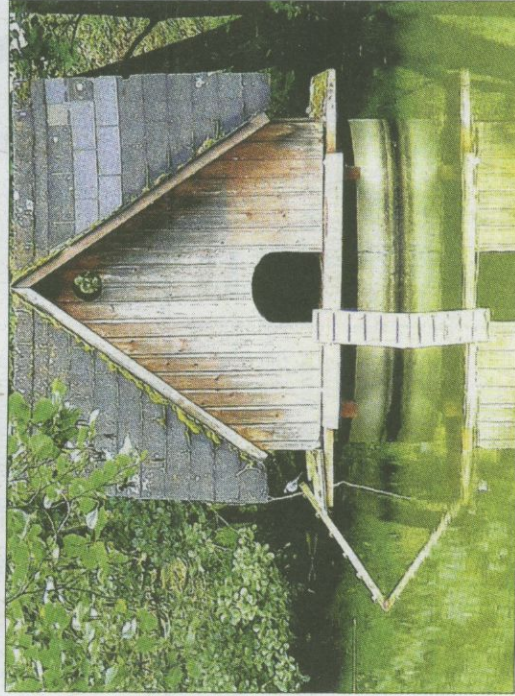
Auf den dritten Platz kam Hendrika Schachner aus Steinach mit »Naturarchitektur auf dem See«.